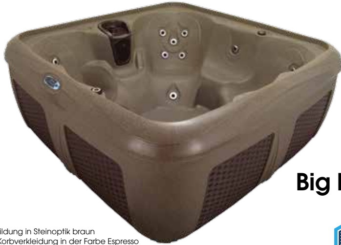
Abbildung in Steinoptik braun mit Korbverkleidung in der Farbe Espresso