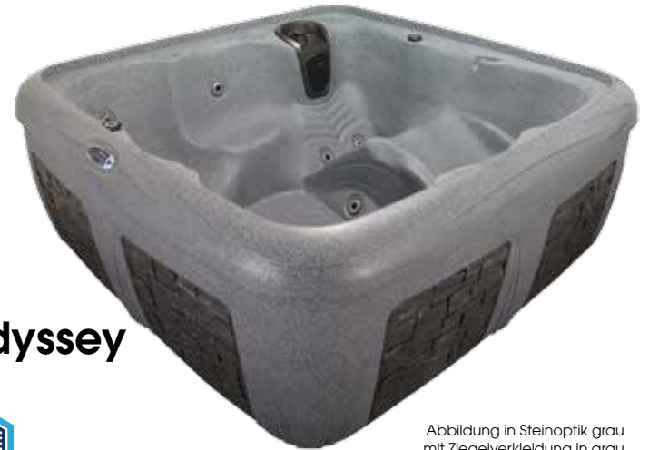
Abbildung in Steinoptik grau mit Ziegelverkleidung in grau